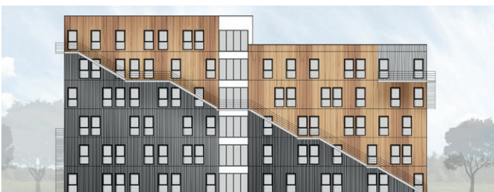
Esquisse 2 - façade est