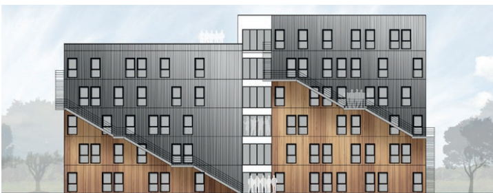
Esquisse 2 - façade ouest

Lors de la seconde esquisse, nous avons donc proposé de jouer avec cet escalier et de le mettre en valeur avec une alternance de bardages bois et métallique.