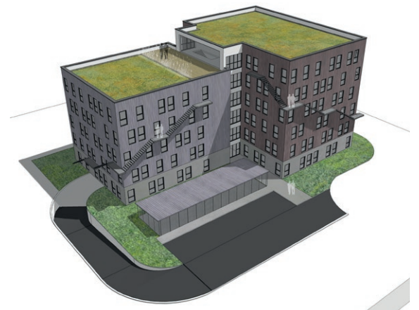
Esquisse 1 - volumétrie