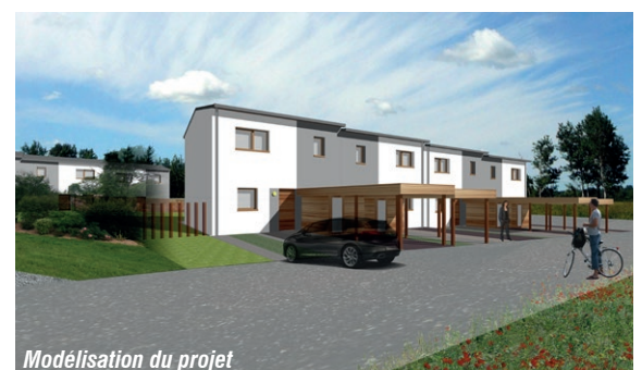
Modélisation du projet