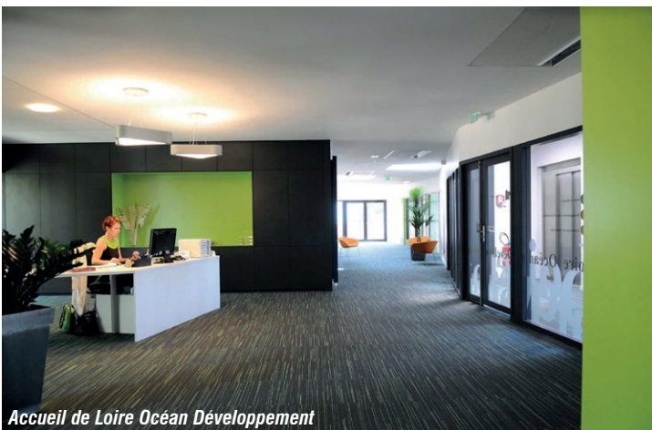
Accueil de Loire Océan Développement