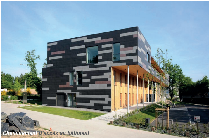
Cheminement d'accès au bâtiment

Cet immeuble de bureaux, siège de Loire Océan Développement, avait pour vocation d'être exemplaire en termes de qualité architecturale et environnementale.